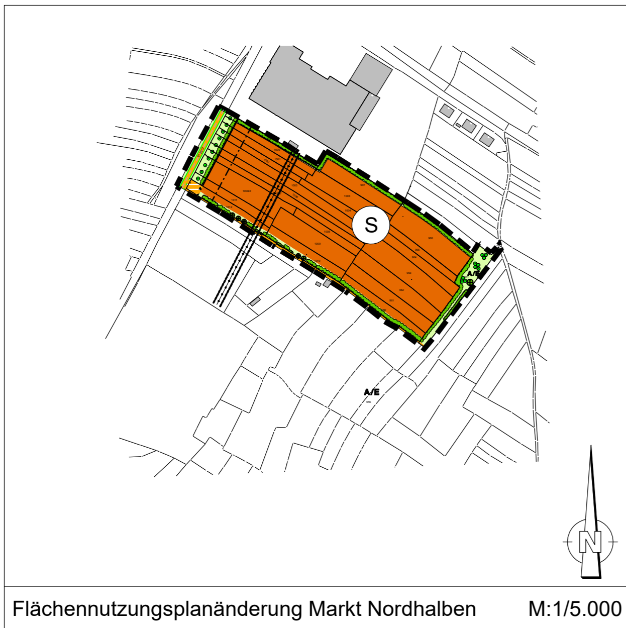
Flächennutzungsplanänderung Markt Nordhalben M:1/5.000