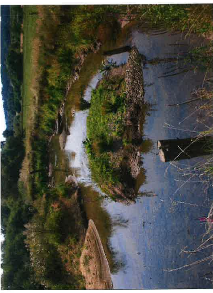
Gew. II, Baunach im Lkr. Bamberg