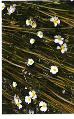
Flutender Wasserhahnenfuß