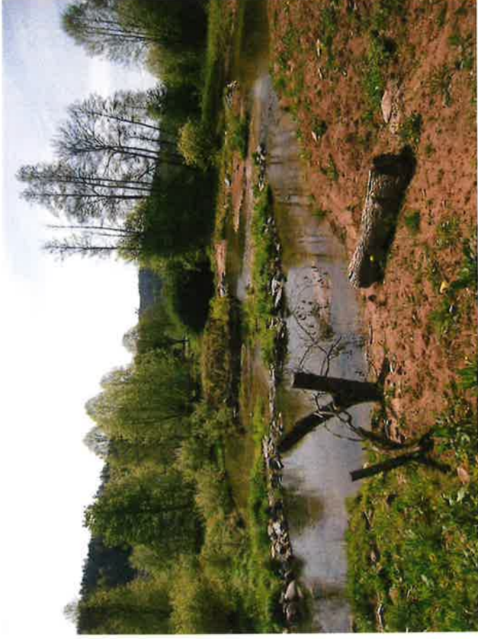
Gew. I, Itz im Lkr. Coburg