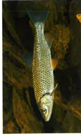
Aitel, Döbel