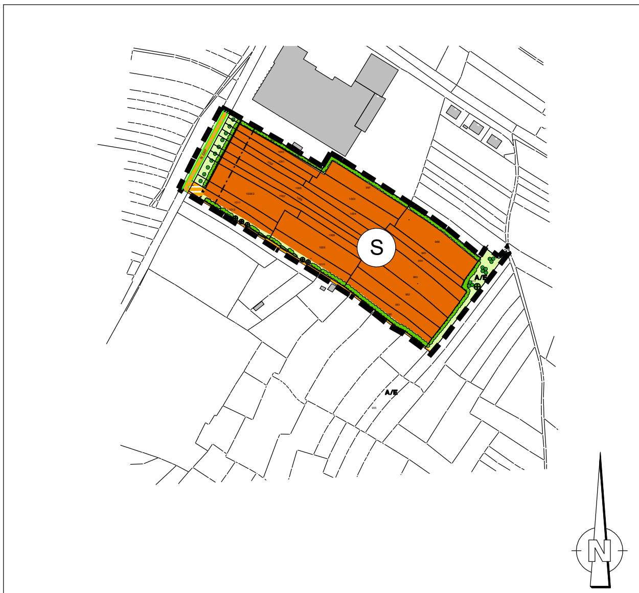
Flächennutzungsplanänderung Markt Nordhalben M:1/5.000